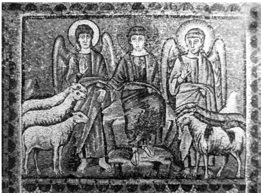
8. Мозайка с Христос, разделящ кози от овци, църква Сант Аполинаре Нуово, Равена, VI в.