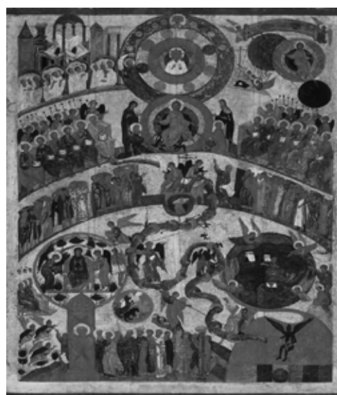
4. Икона на Страшния съд (руски вариант), ДТГ, инв. № 12874 ГТГ, XV в.