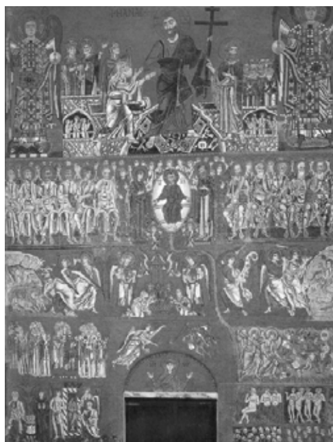
2. Класическа византийска иконография на Страшния съд, църква Санта Мария Асунта, о. Торчело, Венеция, XI в.