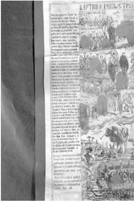
5. Щампа на Страшния съд, НЦИАМ, инв. № 3828, XVIII в.