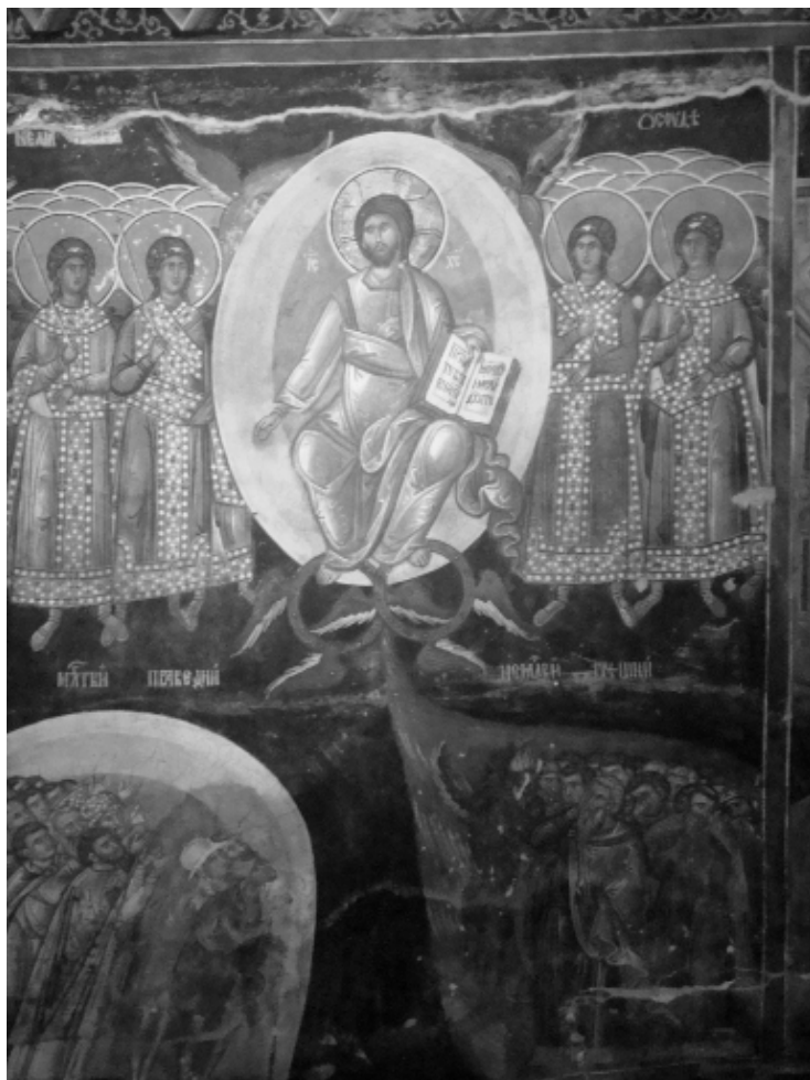
10. Неделя Месопустна, Печка патриаршия, 1561 г.