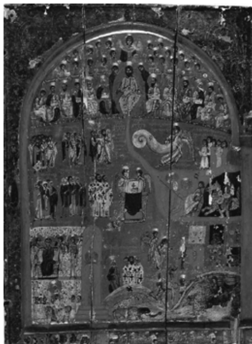
1. Монах Йоан, икона на Страшния съд, Синайски манастир Св. Екатерина, XII в.