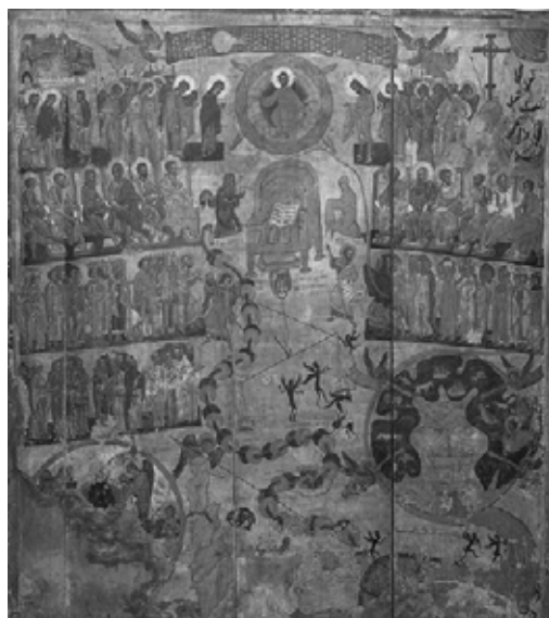
3. Икона на Страшния съд (русиянски вариант) от църквата Рождество Богородично във Вегловка/Ванивка (Полша), ЛМУИ, XV в.